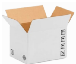
SCATOLA – Cartone ondulato PAP 20