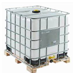
IBC CON BANCALE IN LEGNO – Materiale: Corpo Plastica HDPE 02; Gabbia Acciaio Zincato FE 40; Tappo Plastica HDPE02 - Bancale Legno FOR 50