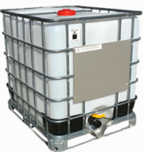
IBC CON BANCALE IN METALLO – Materiale: Corpo Plastica HDPE 02; Gabbia Acciaio Zincato FE 40; Tappo Plastica HDPE02 - Bancale Acciaio Zincato FE 40