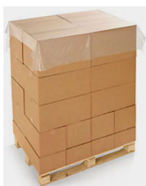
CAPPUCCIO – Corpo LDPE 4