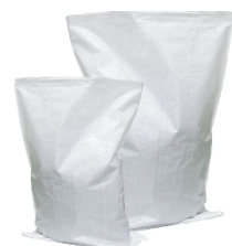
SACCHETTO – Materiale Carta PAP 22