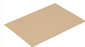
INTERFALDA – Cartone ondulato PAP 20