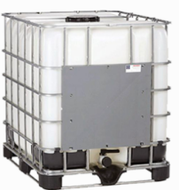
IBC CON BANCALE IN PLASTICA – Materiale: Corpo Plastica HDPE 02; Gabbia Acciaio Zincato FE 40; Tappo Plastica HDPE02 - Bancale Plastica HDPE 02