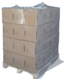
CAPPUCCIO TERMORETRAIBILE – Corpo LDPE 4