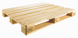
BANCALE IN LEGNO – Materiale Legno FOR 50