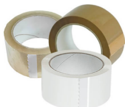
NASTRO ADESIVO – Materiale PP 5